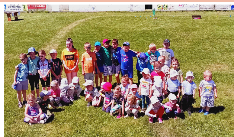
• Naše šikovné deti na športovom dni