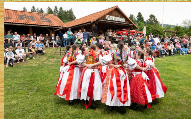
Priateľskú, veselú a družnú pohodu počas celého priebehu ovčiarских slávností vytváral Folklórny súbor Váh z Liptovského Mikuláša