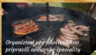
Organizátori pre návštevníkov pripravili ovčiarские speciality