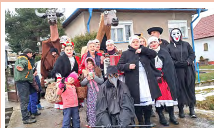
• Fašiangový sprievod v lnej paráde.